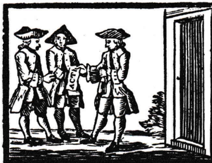
deeze Kooplien heel gezwind, Handlen Aëties van de Wind.!

Begin 1600 begon de VOC met de uitgifte van verhandelbare aandelen. In de jaren daarna ontstond er een levendige handel in aandelen.