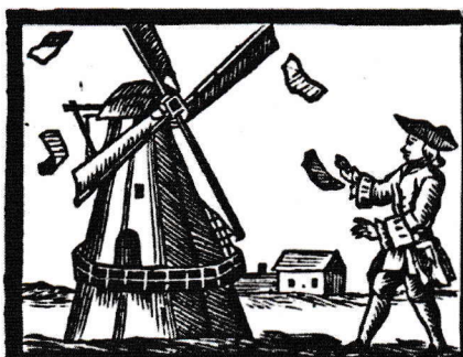
O! die handel zegepraald, daar de Moolen Aëties maald.